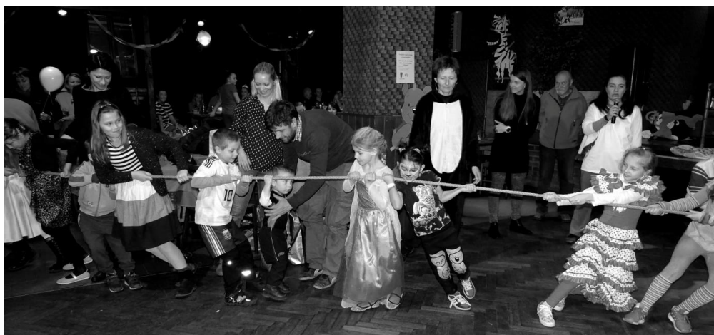
Závěrečnou soutěží bylo oblíbené přetahování lanem