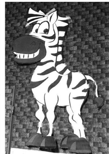
Letos byl karneval na téma "Máme rádi zvířata", čemuž odpovídala i výzdoba sálu

Velké poděkování patří všem, kteří se podíleli na přípravě a organizaci karnevalu, obci Domanín za finanční příspěvek, který poskytla prostřednictvím SDH Domanín, panu Šírkovi za zapůjčení sálu a sponzorům uvedeným pod příspěvkem. Díky nim se karneval skutečně vydařil a věříme, že si ho všichni návštěvníci užili.