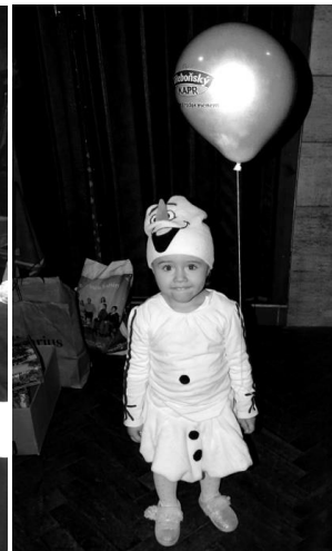
Děti si odnesly balónky plněné heliem

Karneval se protáhl téměř do půl sedmé. Děti dostaly na závěr balónky plněné heliem, které darovala společnost Radima Jirouška - AQUAMONT s.r.o. Některé balónky možná visí na stropě sálu dodnes. :-)