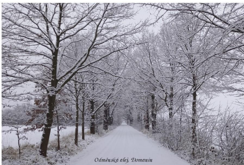
Odměnská alej, Domanín

Rok naplněný pohodou, zdravím, radostí ze života a pracovními úspěchy přeje