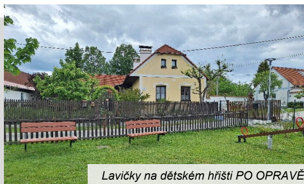
Lavičky na dětském hřišti PO OPRAVĚ

Truhlář využitelná prkna obrousil a natřel. Nepoužitelná prkna vyměnil za nová. Pracovníci obce natřeli kovové konstrukce.