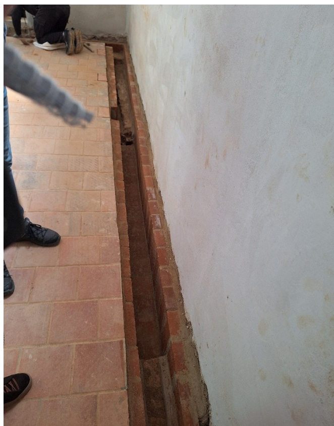
Nový vzduchový průduch po vnitřním obvodu kostela