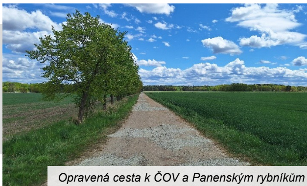
Opravená cesta k ČOV a Panenským rybníkům