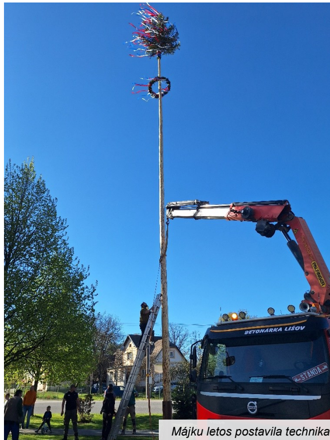
Májku letos postavila technika

SDH Domanín letos zajistil na stavění májky techniku. Je to rychlejší a bezpečnější varianta, trochu však chybělo to napětí a očekávání.