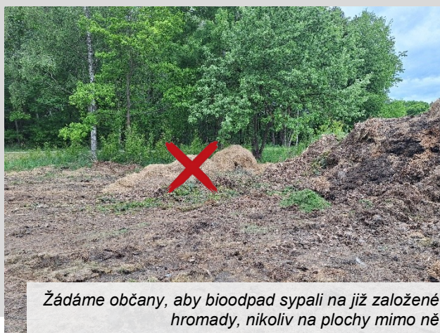
Žádáme občany, aby bioodpad sypali na již založené hromady, nikoliv na plochy mimo ně