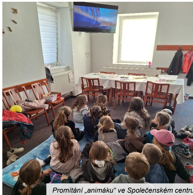
Promítání „animáku“ ve Společenském centru

V 19 hodin se promítal animovaný film, ke kterému děti jako ve správném kině dostaly popcorn.