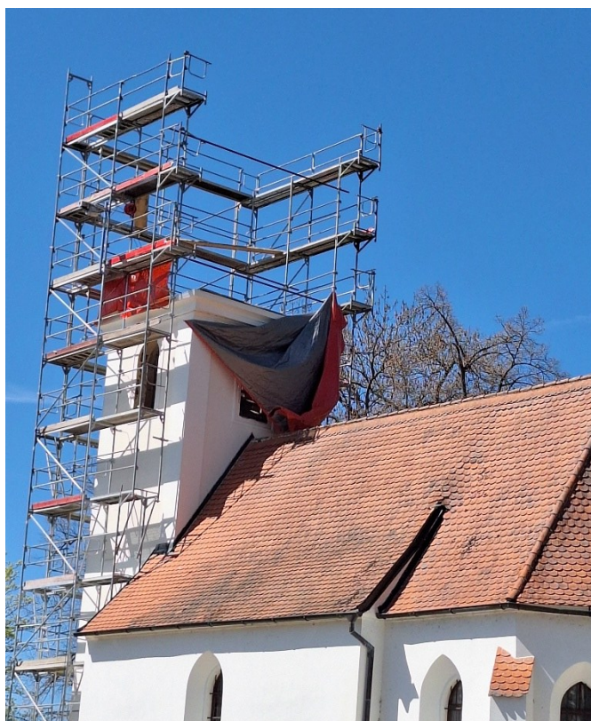
V sobotu 25. 4. se vlivem větru utrhla plachta zakrývající věž. Všimavým občanům děkujeme za okamžité upozornění.