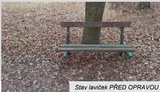
Stav laviček PŘED OPRAVOU