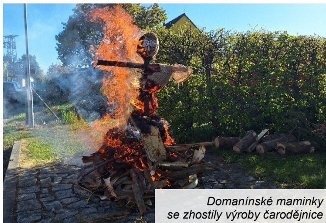
Domanínské maminky se zhostily výroby čarodějnice

Domanínské maminky se ujal program a dalšího občerstvení pro děti ve Společenském centru. Upekly muffiny, rolády, perníky, po kterých se hned zaprášilo. Na upálení vyrobily velkou čarodějnici.