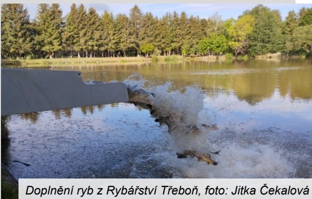
Doplnění ryb z Rybářství Třeboň