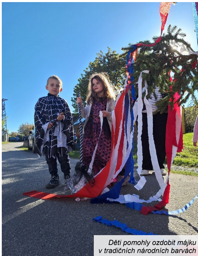
Děti pomohly ozdobit májku v tradičních národních barvách

Májku pomohly národními barvami ozdobit přítomné děti. Na akci přišly v tematických kostýmech.