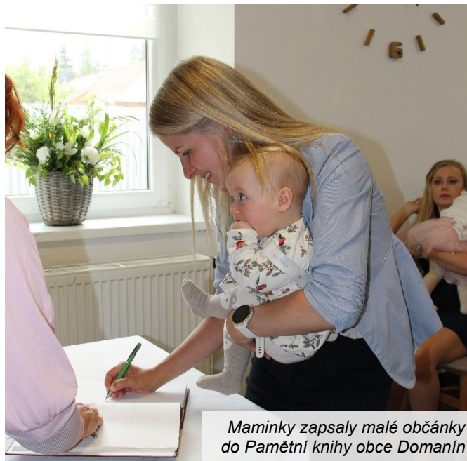
Maminky zapsaly malé občánky do Pamětní knihy obce Domanín