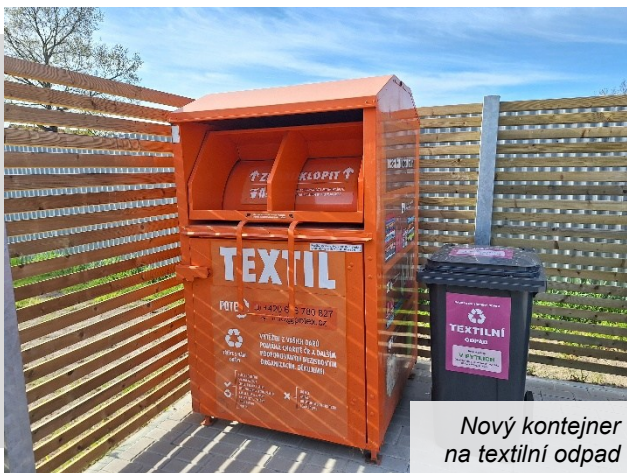
Nový kontejner na textilní odpad