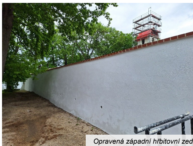
Opravená západní hřbitovní zeď