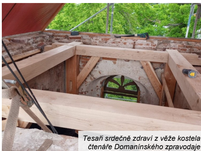
Tesaři srdečně zdraví z věže kostela čtenáře Domanínského zpravodaje