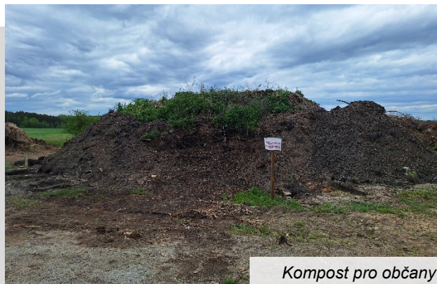
Kompost pro občany