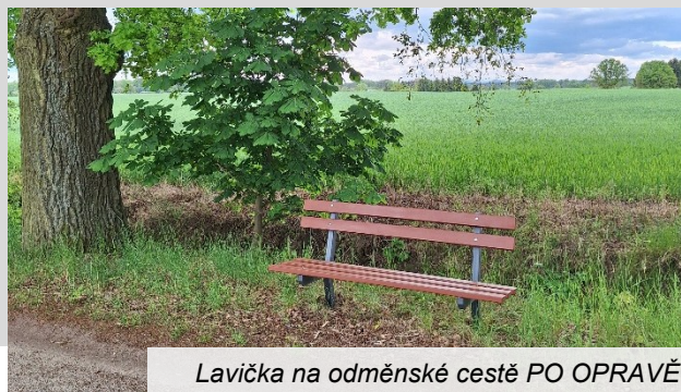
Lavička na odměnské cestě PO OPRAVĚ