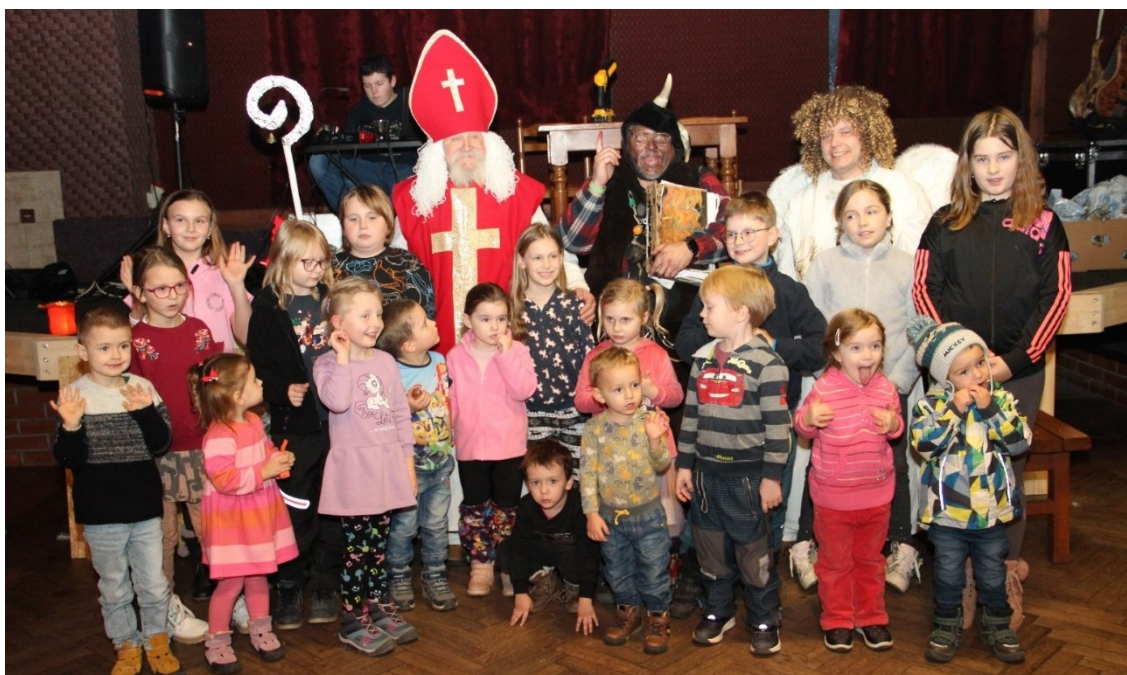
Spolek Domanínských maminek