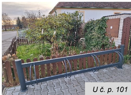
U č. p. 101

K obchodu a k obecnímu úřadu byly dodány nové kolostavy, které vyrobila firma pana Rozbouda.