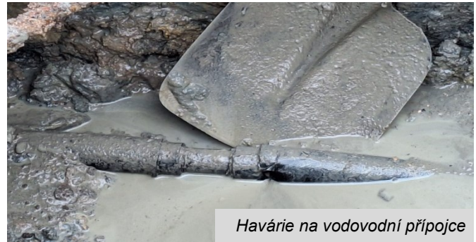
Havárie na vodovodní přípojce

V prosinci jsme na úpravně vody zaznamenali výrazně zvýšený odběr pitné vody. Žádný únik na povrchu viditelný nebyl. Pouze v kanalizační šachtě u obchodu byl slyšet zvýšený průtok vody. Po podrobném hledání jsme zjistili, že příčina je na vodovodní přípojce k soukromé nemovitosti. Vlastník nemovitosti a přípojky však o poruše nemohl vědět, protože únik byl v zahradě ještě před vodoměrem a voda navíc vtékala přímo do šachty na blízké kanalizační přípojce. Po odhalení příčiny byla přípojka neprodleně opravena. Náklady na opravu hradil vlastník připojené nemovitosti, který měl naštěstí pro tyto případy nemovitost pojištěnou. Všem, kteří se podíleli na nelehkém „pátrání“ po úniku vody a poskytli potřebnou součinnost, velmi děkujeme.