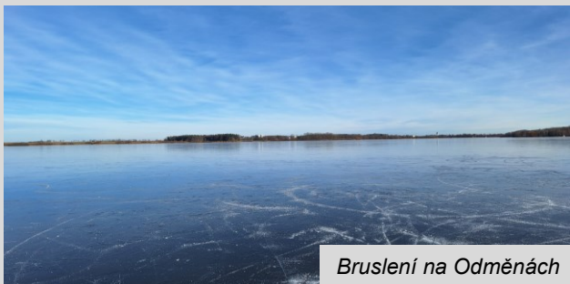
Bruslení na Odměnách

S bruslením na rybnících to bylo o něco lepší. Bruslilo se jak na Stávku a Makšáku v centru obce, tak na Novém či na Odměnách.