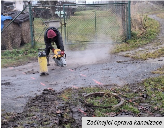
Začínající oprava kanalizace

Díky všímavým občanům se nám podařilo odhalit svalenou a ucpanou kanalizaci okolo komunikace na Slepíku. Jednalo se o úsek kanalizace pod asfaltovým sjezdem, kde historicky zůstalo betonové potrubí. Kanalizace se v tomto místě svalila, ucpana a splaškové vody začaly vyvěrat v nejbližší kanalizační šachtě nad tímto místem. Příčinu poruchy odhalily provedené kamerové zkoušky. Betonová kanalizační trouba byla nahrazena plastovou.