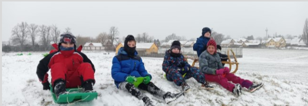
V Domaníně na kopci

zima už se začíná chýlit ke konci, dny se zase prodlužují ... Děti si sněhu užily jen výjimečně – dalo by se spočítat na prstech jedné ruky.