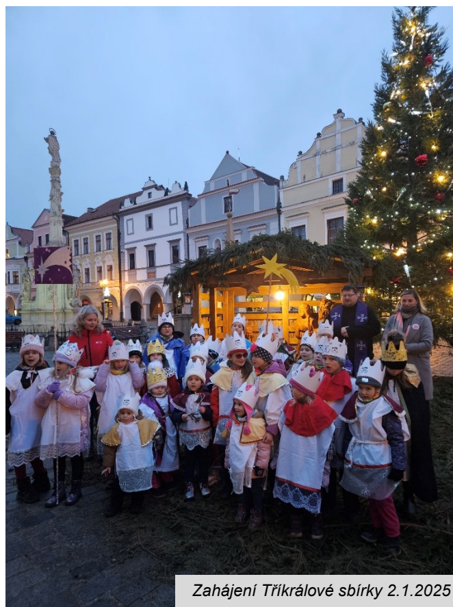
Zahájení Tříkrálové sbírky 2.1.2025

Děkujeme, že jste se k nám připojili svojí laskavostí, štedrostí a dobrou vůlí, a společně s námi v letošním roce přispěli důstojně k oslavě 25. výročí Tříkrálové sbírky.