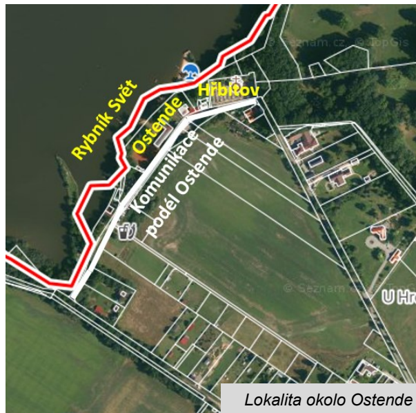
Lokalita okolo Ostende

Komentář: Jedná se o podíl na komunikaci okolo pláže Ostende. Tento podíl historicky patřil zemřelé osobě – nevypořádal se v rámci dědického řízení. Obec Domanín ve spolupráci s Úřadem pro zastupování státu ve věcech majetkových vyvolala doprojednání dědictví, díky čemuž podíl připadl žijícímu dědici. Ten souhlasil s prodejem podílu obci Domanín.