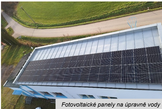
Fotovoltaické panely na úpravně vody

Tento projekt je spolufinancován Evropskou unií .