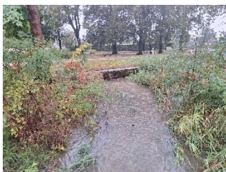
Protipovodňová stoka vedle úpravný vody

Plivem regulování hladiny třeboňské rybníční soustavy se zvedla hladina rybníku Svět a týden po deštích zaplavila voda část pláže Ostende, vodácký klub a část komunikace okolo Ostende.