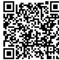
Výsledky krajských voleb v Domaníně

Podrobnější informace za Domanín získáte pod QR kódy níže, kompletní výsledky pak na www.volby.cz .