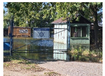
Klub vodáků (za Ostende)