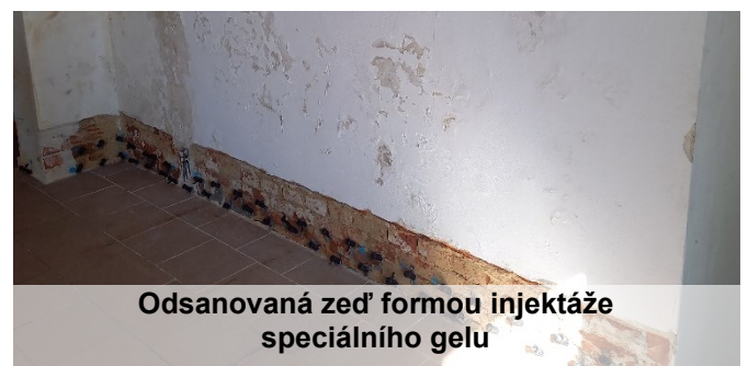
Odsanovaná zeď formou injektáže speciálního gelu

Už teď se těšíme na akce, které se zde budou pořádat.