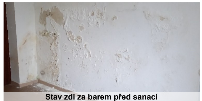
Stav zdi za barem před sanací

Zastupitelstvo tento záměr schválilo těsnou většinou pěti zastupitelů. Tři se zdrželi, jeden byl proti. My však věříme, že se schválený návrh setká u veřejnosti s pozitivním ohlasem. Současně tím, že budou prostory upravené, pravidelně uklízené a využívané, nebudou chátrat. Samozřejmě bude chvilku trvat, než prostory uvedeme do využitelného stavu. V současné době zde proběhla sanace vlhkého zdiva za barem a čekáme na jeho vyschnutí. Poté bude potřeba prostory dovybavit.