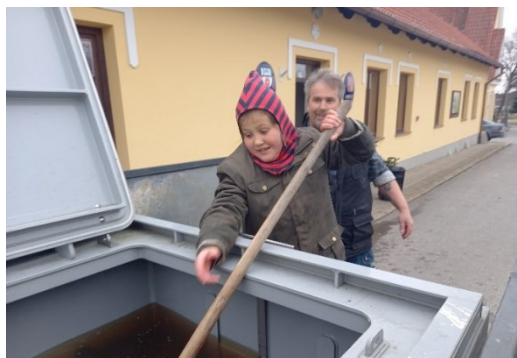
↑ Největší pomocnice při vydávání kaprů ↑